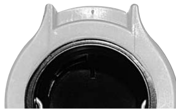
Abb. 1: bisherige Version

Das Anschlussstück wurde mit einem zusätzlichen Steg im Bereich des Entriegelungsknopfes der Steckkupplung versehen. (siehe Abbildung 1 und 2)