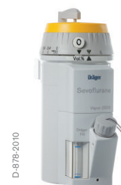
Dräger Vapor 2000 – sevoflurano