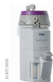
Dräger Vapor 2000 – isoflurano

Cuando se fijan en posición de transporte, se puede inclinar o incluso dar la vuelta al Vapor 2000 o al D-Vapor sin que sufran efectos perjudiciales. El agente anestésico se mantiene de manera segura en el interior del vaporizador. Después de conectar el vaporizador y desbloquear la posición de transporte, quedan listos de inmediato para su uso según las especificaciones.