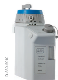
Dräger D-Vapor - desflurano