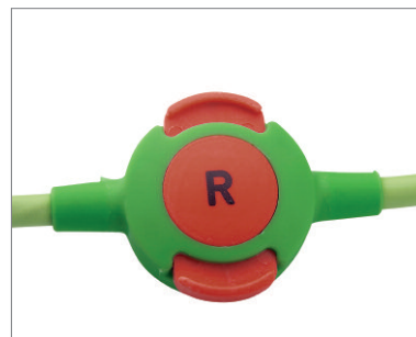
Z-Snap™ - Acoplamiento rápido patentado para electrodos, no requieren ninguna fuerza de inserción