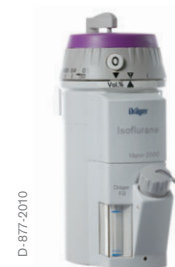
Dräger Vapor 2000 – isoflurano

Cuando se fijan en posición de transporte, se puede inclinar o incluso dar la vuelta al Vapor 2000 o al D-Vapor sin que sufran efectos perjudiciales. El agente anestésico se mantiene de manera segura en el interior del vaporizador. Después de conectar el vaporizador y desbloquear la posición de transporte, quedan listos de inmediato para su uso según las especificaciones.