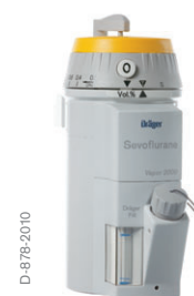
Dräger Vapor 2000 – sevoflurano