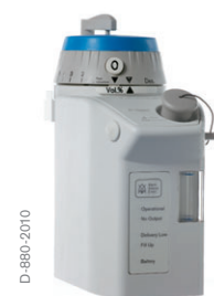
Dräger D-Vapor - desflurano