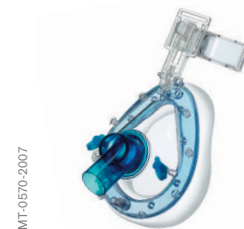
Mascarilla facial completa ClassicStar® NIV con codo estándar (SE).