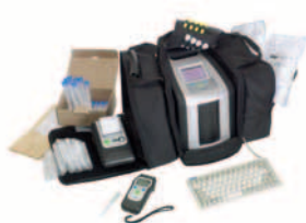
Bärväska med komplett system