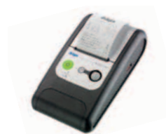
Dräger mobil skrivare