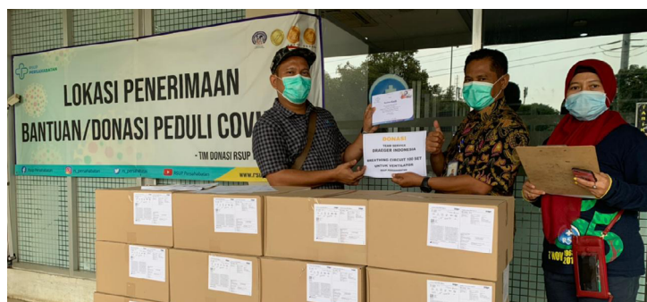
Dräger Service Medical Donasi ke RUSP Persahabatan

Dalam edisi kali ini Service MD melakukan beberapa kegiatan salah satunya adalah donasi aksesoris pendukung terutama untuk Ventilator. Donasi yang disampaikan berupa Breathing Circuit Disposable Ventilator Transport Oxylog Family . Ada donasi kali ini Rumah Sakit Umum Pusat Persahabatan Jakarta menjadi target karena merupakan salah satu rumah sakit rujukan pasien COVID-19 yang mana mesin Ventilator pasti digunakan dengan terus menerus terlebih dalam kondisi Pandemi. Donasi disampaikan pada minggu ke-2 January 2021.