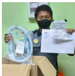
RSUD Muhammad Sani Tanjung Balai Karimun Kepulauan Riau

RSUD Tanjung Balai Karimun – Kep Riau RSUD Bangkinang – Riau RSUD Patala bumi – Riau RSUD Sekayu RSUD Banyuasin