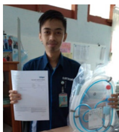
RSUD Tarakan Kalimantan Utara

RSUD M. Sani Karimun - Ariyadi Terimakasih kepada Draeger Indonesia, donasi sudah kami terima dengan baik dan sangat bermanfaat. Sekali-sekali kami mohon di visit.. 5:41 am