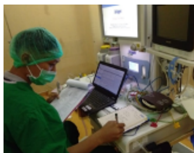
RSUP Jombang - Jawa Timur