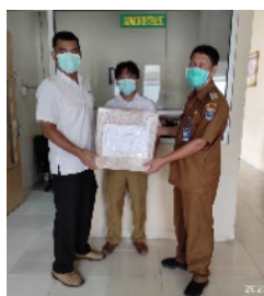
RSUD Kabelota Donggala Sulawesi Tengah

RSUD Tarakan KALTARA - Ciptadi Sudah diterima dengan baik. Oxylog kami sudah lama di afkir, tapi circuit donasi nya bermanfaat karena dapat digunakan di merk lain. Terimakasih 5:43 am