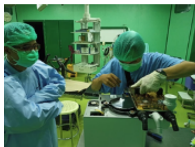
RSUP Persahabatan – Jakarta

Dräger selalu tetap memberikan pelayanan yang maksimal salah satunya Service Safety Dräger Indonesia. Dengan tetap memperhatikan protokol kesehatan kami tetap melayani seluruh pelanggan kami, dengan memberikan pelatihan gratis implementasi pemasangan alat Safety Dräger.