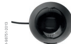
Handteil und Steuereinheit Interlock® 7000