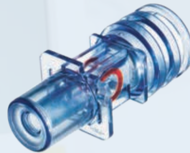
Chambre de mesure de CO 2 réutilisable - Pédiatrique

La chambre de mesure du CO 2 se place au sein du circuit patient entre la pièce en Y et le tuyau. Un capteur de CO 2 peut être connecté à la chambre de mesure. Le mélange gazeux est évalué en permanence par le capteur de CO 2 connecté et sa valeur est affichée à l'écran du ventilateur.