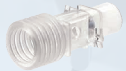
Chambre de mesure de CO 2 à usage unique - Adulte