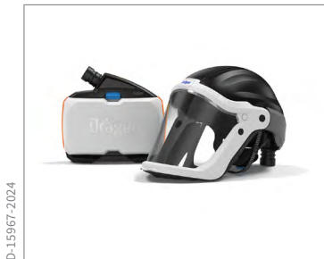
以下為 X-plore 8000 頭盔 PC 面鏡 HL1，是寬鬆型頭部防護裝備的典型組合