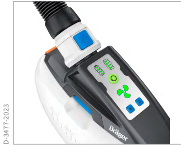
氣流速率、過濾罐飽和度和電池電量的狀態顯示