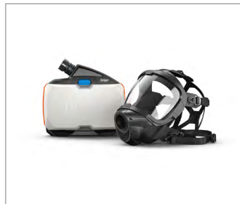
以下為 FPS 7000，是密合型頭部防護裝備的典型組合