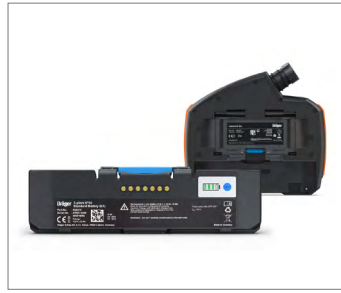
可更換電池，並具備充電狀態智慧顯示功能