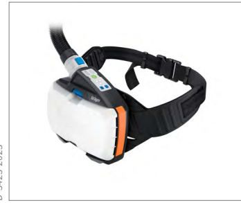
X-plore 8700 系統，配備背負解決方案