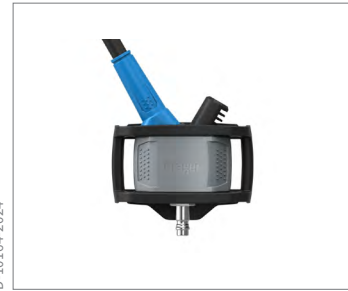
Dräger PAS X-plore