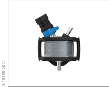
Dräger X-plore 9300