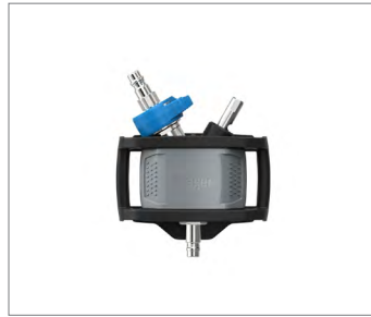
Dräger X-plore 9500