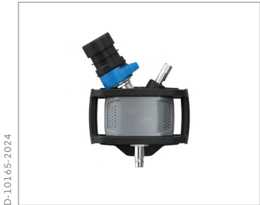
Dräger X-plore 9300