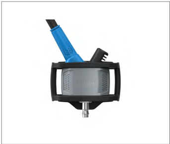
Dräger PAS X-plore