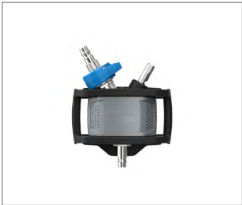
Dräger X-plore 9500