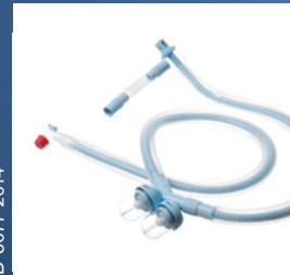
Coax sempurna dengan perangkat air