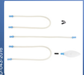
Sirkuit Pakai Ulang: BlueSet