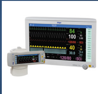
Infinity® Acute Care System C700