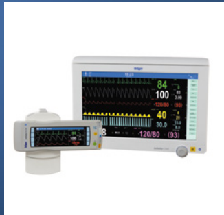
Infinity® Acute Care System C500