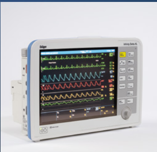
Infinity® Delta XL