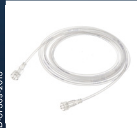
Pengambilan sampel gas pasien