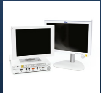
Infinity® Omega S