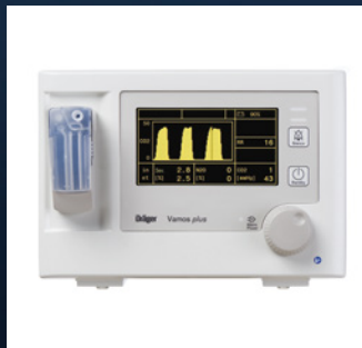
Vamos / Vamos plus