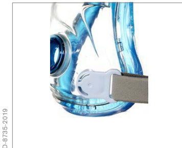
D-8735-2019 NovaStar® plus mágneses kapocs