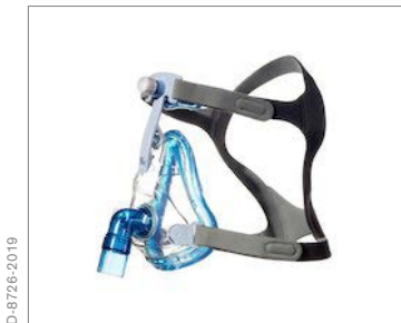
D-8726-2019 NovaStar® plus fejpánttal