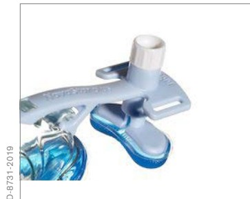
D-8731-2019 NovaStar® plus homlokpárna