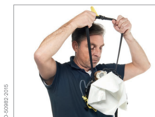
Don the neck strap. The breathing bag points away from your body.