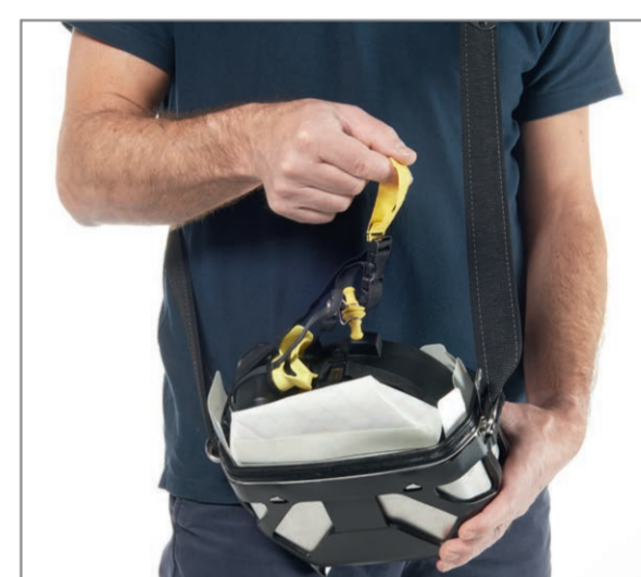
Grasp the yellow loop of the neck strap and pull the device out of the housing.