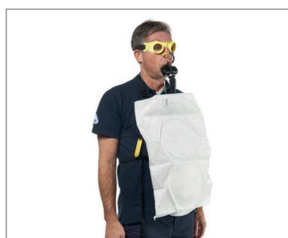
Ready to escape.