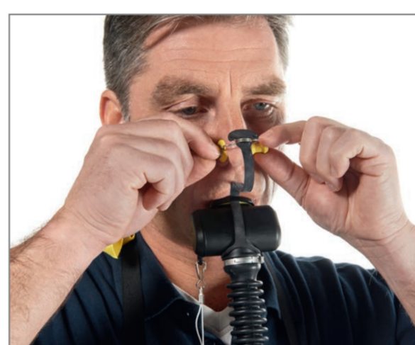
Position the nose clip on your nose.