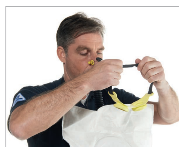
Release the goggles from the button strap and put them on.