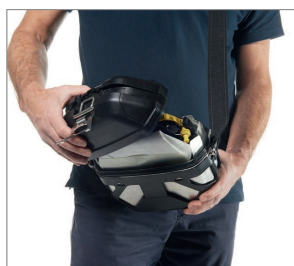
Remove the top cover.