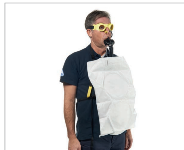
Legen Sie das Brustband um, schließen Sie es und ziehen Sie es straff.