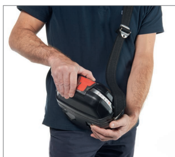
Pull up the opener until the tightening straps fall off.