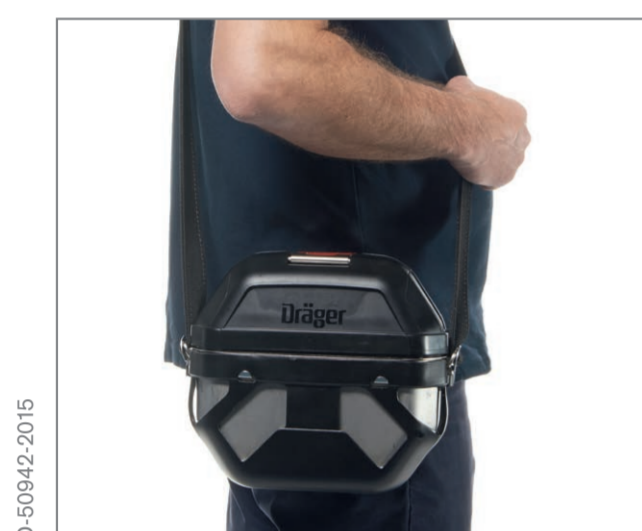
Dräger Oxy 3000/6000 MKII