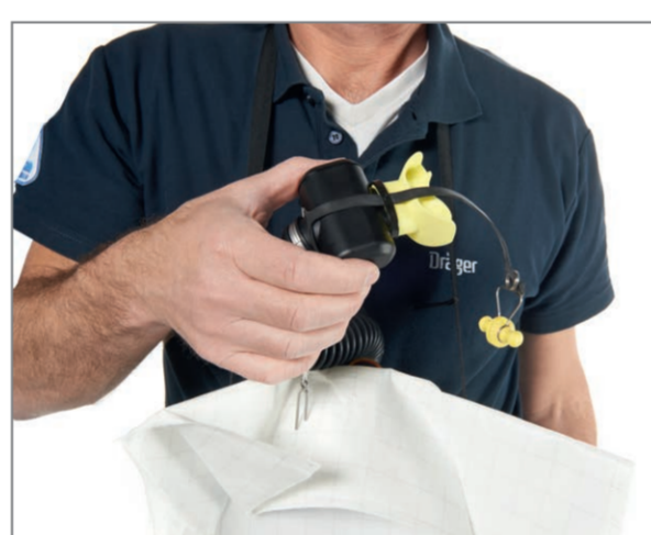
Pull the mouthpiece towards your face and put it into your mouth.