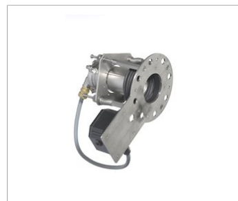
Dräger Pulsar 7000 Heavy Duty