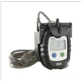
Módulo de comunicación MILO