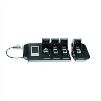
Dräger X-dock® 5300/6300/6600

La serie Dräger X-dock® le proporciona pleno control sobre sus instrumentos portátiles de detección de gases. Las pruebas de funcionamiento y las calibraciones automáticas, con consumo reducido de gas así como la menor duración de las pruebas, suponen un ahorro de tiempo y dinero. La documentación y evaluaciones completas proporcionan una información muy clara y precisa.