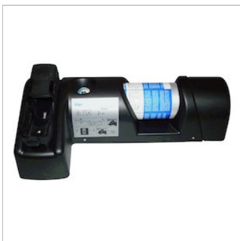
Estación Dräger Bump Test

Fácil de usar, portátil y sin instalación. Con esta estación se pueden realizar pruebas de funcionamiento con gas y comprobación de los avisos de alarma de un manera rápida y sencilla.