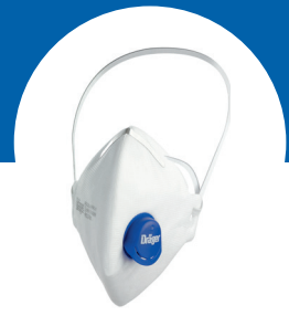
X-plore 1730 V FFP3 mit Ausatemventil

* Empfehlung für die Pandemievorsorge: FFP2 ohne Ventil. FFP1 Masken werden daher nicht an dieser Stelle gezeigt.