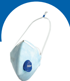
X-plore 1720 V FFP2 mit Ausatemventil