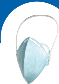
X-plore 1720* FFP2