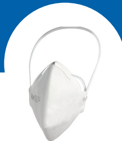
X-plore 1730* FFP3