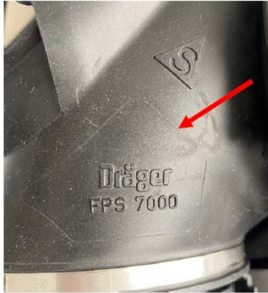
„Bestehende“ Größe S

Zu unterscheiden sind die alten und neuen Maskenkörper Größe S am Bauteil selbst: Bei der bisherigen Version ist um den Namen „Dräger FPS 7000“ herum ein leichter Rahmen zu erkennen, bei der aktuellen Version ist dieser Rahmen nicht vorhanden.