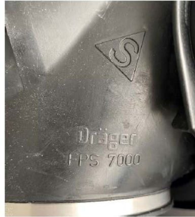
„Neue“ Größe S

Wir wollen sicherstellen, dass es nicht zu Verwechslungen der alten und neuen Varianten kommt. Deswegen prüfen wir aktuell die Vergabe neuer fester Sachnummern, die jederzeit eine klare Zuordnung ermöglichen.