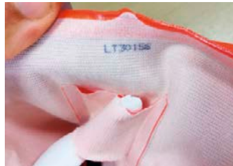
Bild 2: Chargennummer unterhalb der Kordel