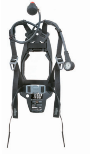
Dräger PAS® Lite

Kantojärjestelmä on kehitetty vähentämään selän kuormitusta, räsitystä ja väsymistä. Siinä käytetyt uudet materiaalit on muotoiltu siten, että istuvuus sekä hartioilla että vyötäröllä on mahdollisimman hyvä. Hihnojen innovatiivinen muotoilu takaa painon tasaisen jakautumisen hartioille. Kestävä kumipinnoitettu materiaali on erittäin kärtömukava ja kemikaalinkestävä ja on lisäksi läpäissyt EN137-standardin tyypin 2 laitteilta vaadittavan liekkitestin.