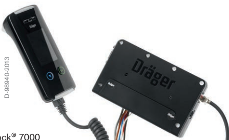
Dräger Interlock® 7000

Mit der atemalkoholgesteuerten Wegfahrsperrung Interlock 7000 entscheiden Sie sich für ein genaues und zuverlässiges Gerät. Schalten Sie die Zündung Ihres Fahrzeugs ein und geben Sie einen Atemtest ab. Wenn die gemessene Atemalkoholkonzentration unter dem eingestellten Grenzwert liegt, können Sie den Motor starten.