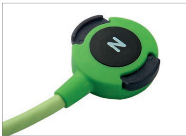
Clips de fermeture brevetés Z-Snap™