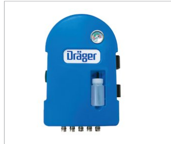
Filtro Dräger PAS® - portátil