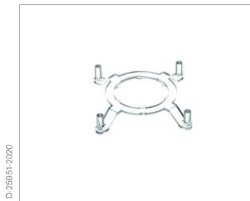
Hakenring für SediStar Maske