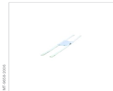
Kopfband, weicher Stoff