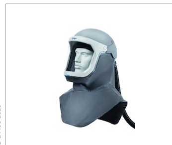
Casco Dräger X-plore® 8000 con visera L2Z