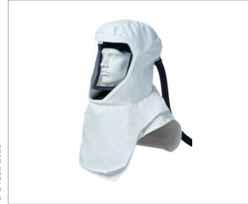
Casco Dräger X-plore® 8000 con visera L3T4